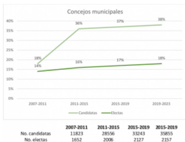
Grafica No. 1. Mujeres candidatas y electas en concejos municipales