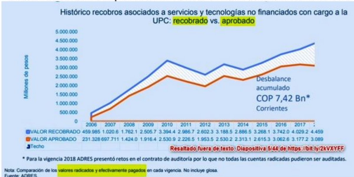
Gráfico N°2: Datos con los que se calculó el déficit acumulado del Acuerdo de Punto Final

Nuevos VMR, Acuerdo de Punto Final, Techos de Recobro y proyecto de Ley 10 de 2020 Políticas públicas en salud basadas en información con inconsistencias y necesidad de un cambio estructural