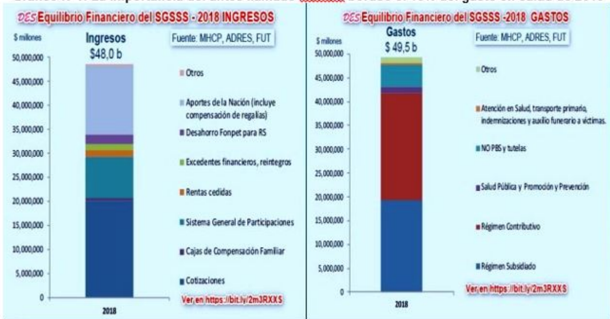
Gráfico N°1: La importancia del antes llamado NoPOS bordeó el 10% del gasto en salud de 2018

Obviamente el sistema de salud necesita una reforma estructural de todo el Sistema de información.