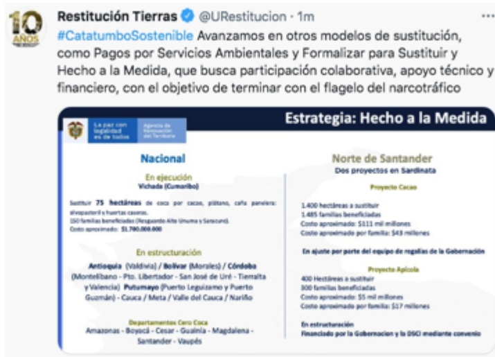
Gráfica extraída de trino publicado por la Unidad de Restitución con motivo de evento “Catatumbo sostenible”, realizado el 25 de junio de 2021, en Sardinata Norte de Santander.

Aunque este gobierno le dio un impulso inicial a los PDET, terminó dejando a un lado la participación ciudadana que movió la primera etapa de la construcción de tales planes, sustituyéndola por firmas consultoras que diseñaron una hoja de ruta única para terminar dedicado principalmente a la priorización de proyectos tramitados a través del OCAD Paz y, por último, a resguardar los respaldos de sectores políticos que se apropiaron en los territorios del discurso y de los proyectos PDET. La consejería para la estabilización reportó, mientras se escribía esta nota, que a través del OCAD Paz se han aprobado 365 proyectos por valor superior a los 3,7 billones de pesos.