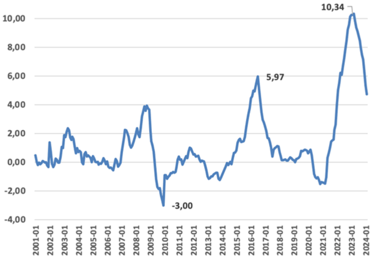
Diferencia entre la inflación efectiva y la meta definida por el Banco de la República Valores mensuales, desde enero 2001 hasta febrero 2024