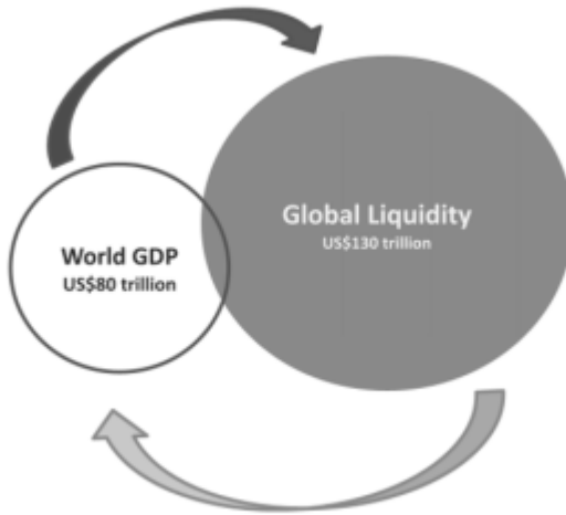
Fig. 1.1 Global Liquidity

No hay nada nuevo en la visión de Howell. De hecho, varios autores, incluido yo, han señalado el enorme aumento de “liquidez”, es decir, de la oferta de dinero, del crédito bancario, de la deuda (tanto pública como privada) y de los instrumentos de deuda como los derivados, particularmente desde principios de la década de 2000.