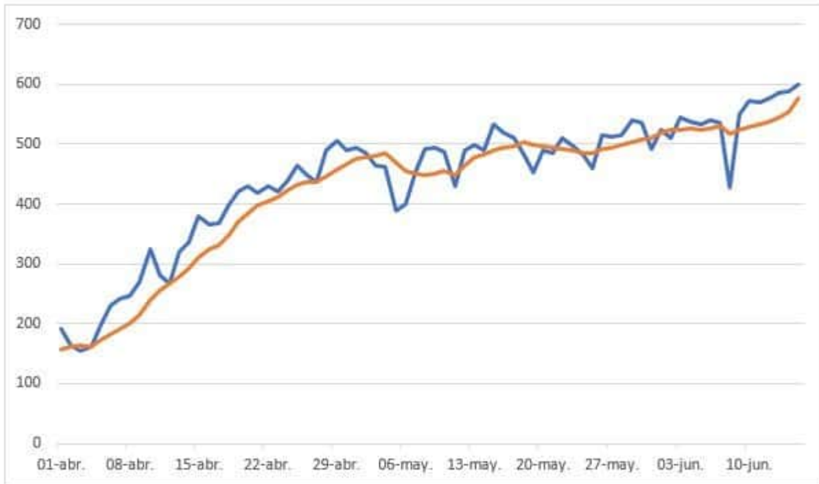
Gráfico 2 La evolución de los muertos a nivel nacional del 1 de abril al 15 de junio

Sigue la concentración de los casos y muertos en seis regiones