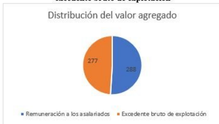
Gráfico 2- Distribución del valor agregado entre remuneración a los asalariados y excedente bruto de explotación