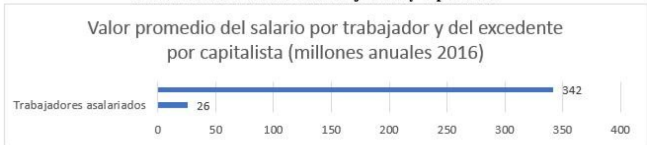
Gráfica 3 Tamaño de las cucharas de trabajadores y capitalistas

Esta es la “desigualdad básica” dentro del capitalismo colombiano: por un lado, los trabajadores que elaboran todo el producto y su valor, pero que tienen que entregar la mitad al otro grupo que acumula los ingresos y la riqueza. Esto ocurre todos los años y por tanto los capitalistas acumulan cada vez más, llegando al extremo de que una sola persona, como Luis Carlos Sarmiento tiene una fortuna cercana a $10.000 millones de dólares, aproximadamente $37 billones de pesos una cifra que alcanzaría para pagar un salario mensual a 37 millones de personas.