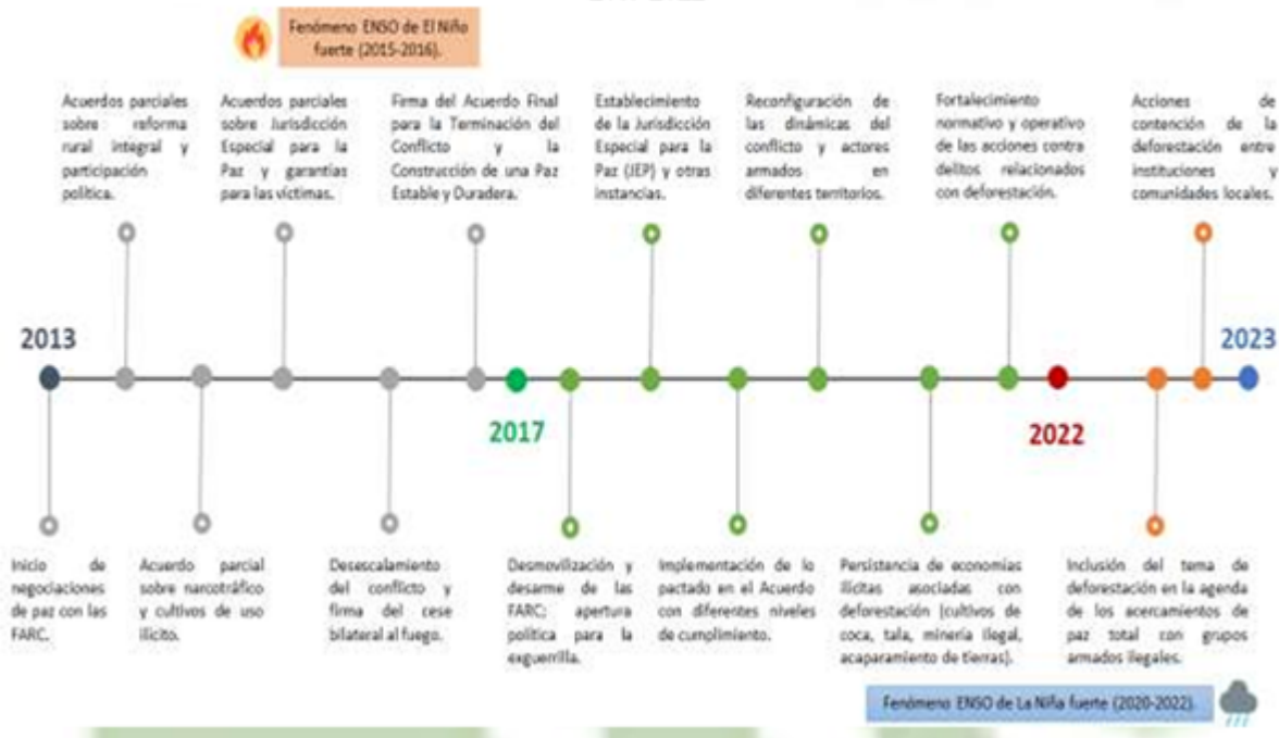
Figura 13. Línea de tiempo de los eventos sociopolíticos y climáticos relevantes en Colombia durante período 2013-2022

Así, para el ajuste por circunstancias nacionales del promedio histórico de emisiones por deforestación para el NREF 2023 - 2027, se identificaron dos períodos clave. El primero corresponde a la firma del acuerdo de paz con las FARC-EP y a la influencia del fenómeno de El Niño en la reducción de precipitaciones y el aumento de incendios, que abarcan el período entre 2013 y 2016. El segundo período, entre 2017 y 2021, se refiere a la etapa de posconflicto o posacuerdo y la ocurrencia del fenómeno de La Niña que se caracterizó por el aumento y persistencia de las precipitaciones. Para entender el efecto que estos eventos sociopolíticos y climáticos tuvieron sobre la deforestación a nivel nacional y regional, se presenta la siguiente tabla con la información sobre deforestación: