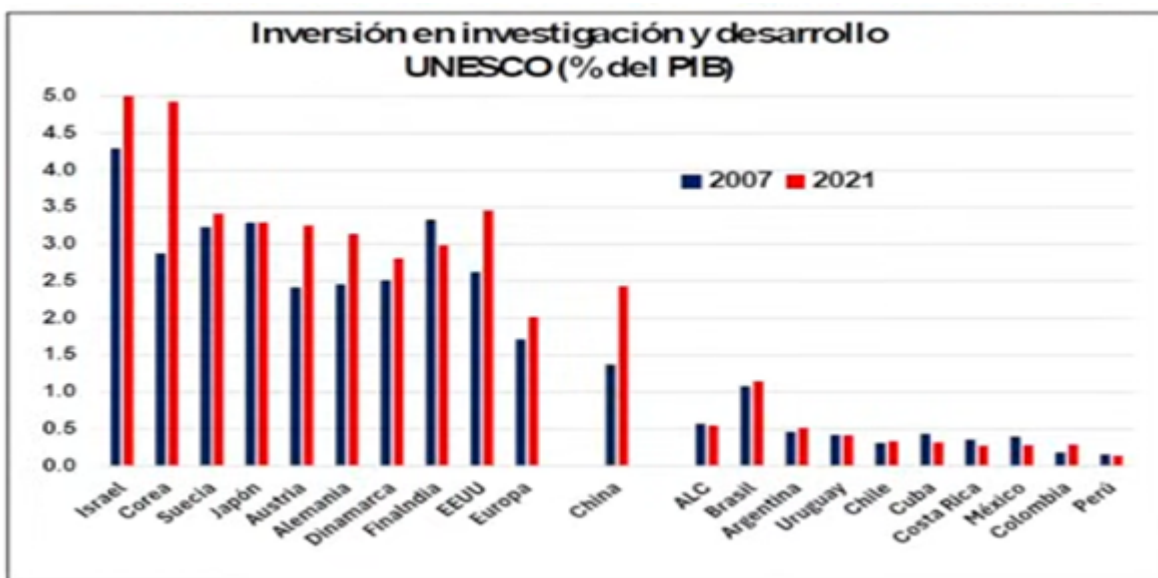
Grafico 2. Inversión en Investigación y Desarrollo como % del PIB.